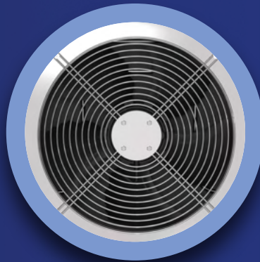
FILTRO DE AIRE