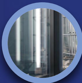
PUERTA CON LUZ LED