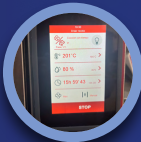
LIBRO DE RECETAS

Podemos regular tiempo de cocción temperatura de cocción, temperatura de la sonda, porcentaje de humedad de la cocción, nivel de potencia de la turbina, inyección de vapor.